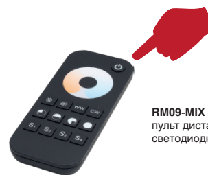
RM09-MIX пульт дистанционного управления светодиодными лентами