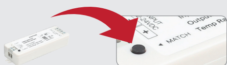
SM02-MIX (приобретается отдельно) контроллер для двухканальных светодиодных лент 3000K+6500K